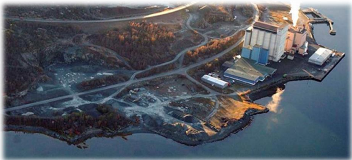
Bergneset kai

Prisregulativ og vilkår fastsatt av Balsfjord kommunestyre den 02.12.20 med hjemmel i lov 2019-06-21-70 om havner og farvann